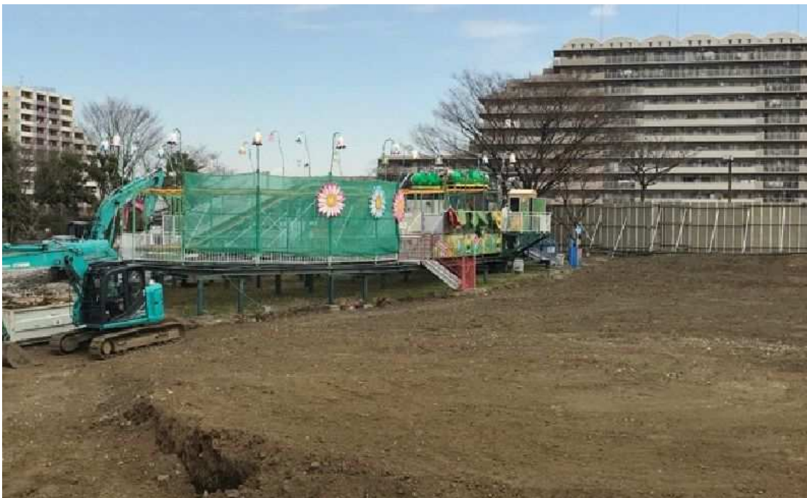
管理事務所2階から北西方向の写真