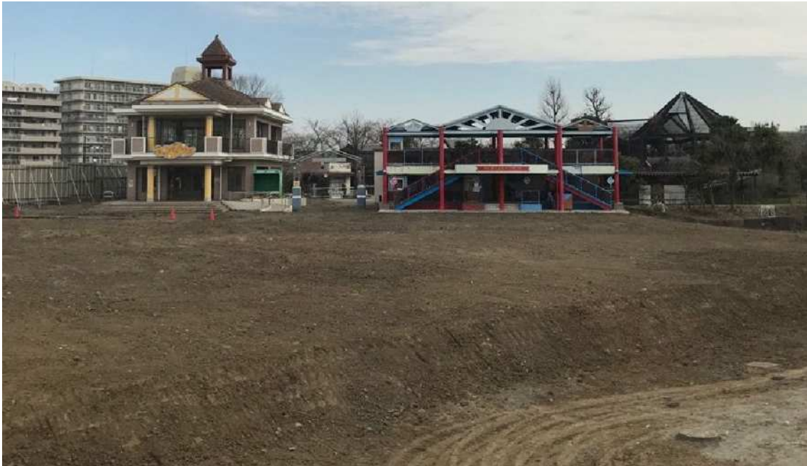
管理事務所2階から北東方向の写真