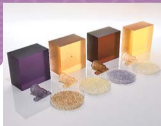
▲最優秀賞「積層成形ブロック L-CUBE」

区内中小企業者が開発した優れた新製品・新技術を表彰するとともに、新製品等の開発気運の醸成と区内産業の活性化を目的に、「荒川区新製品・新技術大賞」を実施しました。受賞企業は、下表のとおりです。