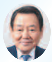
荒川区長・特別区長会会長 にしかわ たけし 西川 太一郎

新年度がスタートし、区の木である桜の花の咲く季節となりました。私は、新年度を区の確かな未来を築くためのチャレンジの年にしたいと考えています。首都直下地震への備えの充実や、子どもたちが希望を持って未来に進むことが出来る環境づくりの整備など、区民の皆さんがなお一層幸福を実感して頂けるよう将来を見据えてさまざまな事業を展開していきます。また、区民の文化・スポーツ活動の更なる振興のために「地域文化スポーツ部」を新設しました。