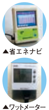
▲省エネナビ ▲ワットメーター

区施設の節電・省エネ 区の各施設では、扇風機を利用して冷房運転を控えます。また蛍光灯の引き換えや消灯を行います。 元祖・本家あらかわ街なか避暑地 *実施期間は、施設により異なります。 *実施時間は、施設により異なります。 *実施施設 各ふれあい館・ひろば館(一部)、各区立図書館、荒川さつき会館、アクト21、子育て交流サロン、あらかわエコセンター 他。 *詳細は、お問い合わせ頂くと、荒川区ホームページ(アドレスは1面下欄参照)をご覧ください。