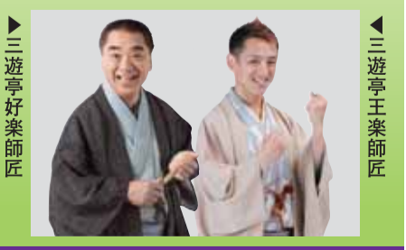
▶三遊亭好楽師匠 ▲三遊亭王楽師匠

日時 11月6日(木) 午後6時開演 *開場は、午後5時30分 会場 日暮里サニーホール 定員 200人(抽選) 出演 三遊亭好楽師匠(荒川区観光大使)、三遊亭王楽師匠 他 入場料 無料 申込み方法 地域振興課・各区民事務所・ふれあい館で配布する申し込み用紙に参加者全員の住所・氏名(3人まで)・電話番号を明記し窓口に提出 *はがきに必要事項を記入し、郵送でも申し込みます 締切り 10月21日(火)午後5時まで *郵送の場合は10月21日消印有効 *当選者には10月27日以降、入場券を郵送します 申込み・問合せ 〒116-8501荒川区荒川2-2-1 3 荒川区役所3階地域振興課 ☎内線2531