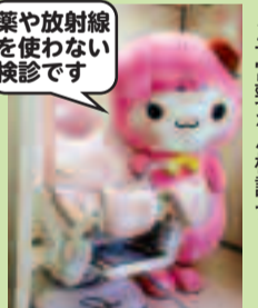
子宮頸がん検診台