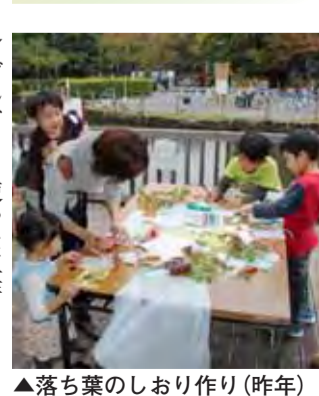
▲落ち葉のしおり作り(昨年)