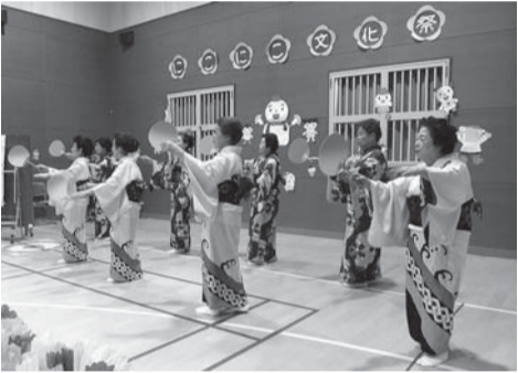
▲昨年の発表会の様子

内容・日時 ▽作品展：2月13日(金)・14日(土) 午前10時～午後3時 * 14日は、午後2時まで ▽発表会：2月14日(土) 午後1時～3時 ▽ふれあい製作コーナー：2月14日(土) 午前10時～午後2時 会場・問合せ 南千住駅前ふれあい館 ☎(3803) 0571 FAX(3803) 0572