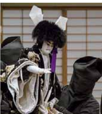
▲人形浄瑠璃演目の様子

申込み・問合せ 〒116-0002 荒川区荒川7-20-1 町屋文化センター内ACC ☎(3802)7111 FAX(3802)7117