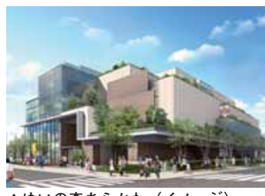
▲ゆいの森あらかわ(イメージ)

図書館・吉村昭記念文学館・子ども施設を融合し、あらゆる世代の方が利用出来る施設として整備を進めている、(仮称)荒川二丁目複合施設の愛称です。 愛称は、区民投票・選定委員会の厳正な審査を経て決定しました。 申込み・問合せ 〒116-0001 荒川区荒川2-2-3 荒川区役所文学館友の会担当(複合施設準備室内) ☎内線2256