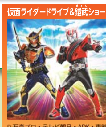
◎石森プロ・テレビ朝日・ADK・東映

右表のプログラムのとおり、さまざまな公演を行います。 ※ステージプログラムは、都合により変更する場合があります