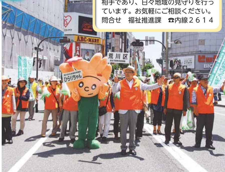
▲平成26年度民生委員・児童委員活動普及・啓発パレード