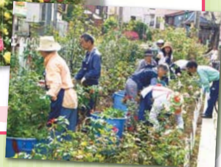
バラの会の活動風景▶