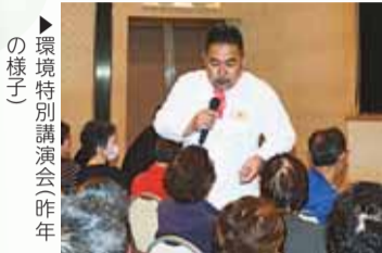
▶環境特別講演会(昨年の様子)

区民・事業者・行政が協働して、地球温暖化対策に関する身近な取り組みを広げるため、環境・清掃フェアへの出展やライトダウンキャンペーン、環境特別講演会の開催等を行っています。