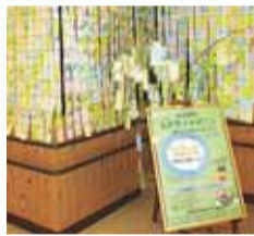
◀昨年の様子(ライトダウンキャンペーン)

※キャンペーン期間中（6月22日<夏至の日>、7月3日・4日<ホテル観賞の夕べ>等）の消灯にご協力ください