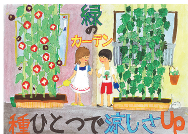
平成26年度エコポスターコンクール最優秀賞作品

応募・問合せ 〒116-0002 荒川区荒川1-53-20 あらかわエコセンター2階 環境課 ☎内線482 ※エコ標語コンクールは、平成26年度で終了しました