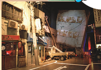
▲災害のジオラマも展示しています