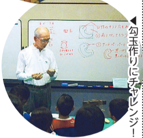
勾玉作りにチャレンジ!