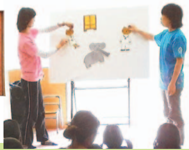
▲たんぽぽシアターの様子

会場・問合せ 荒川たんぽぽセンター ☎(3891)6824 FAX(3807)8483