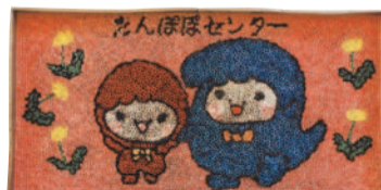
▲色紙のロールモザイク