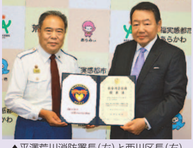
▲平澤荒川消防署長(左)と西川区長(右)

9月9日、東京消防庁から区に救命講習受講優良証と優良マークが交付されました。これは、上級救命講習の受講や応急手当普及員の配置等、応急手当の普及に積極的に取り組んでいる事業所等に対して交付されるものです。 区は今後もさらに救命体制の整備について進めていきます。