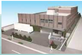
▲リサイクルセンター完成イメージ

資源の中間処理や処理工程の見学・体感学習等を通じた普及啓発を行う(仮称)荒川区リサイクルセンターを整備しています。 7月から建設工事を開始し、平成28年9月竣工予定です。