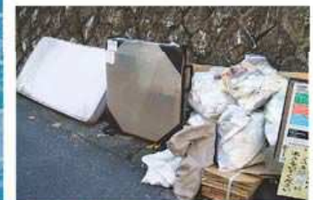
▲集積所に不法投棄された粗大ごみ

ごみの集積所に、粗大ごみである布団・敷物・スーツケース、資源、家電リサイクル品目であるテレビ・冷蔵庫等が、数多く不法投棄されています。 ごみ・資源の正しい出し方にご協力をお願いします。