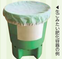
▲生ごみたい肥化容器の例