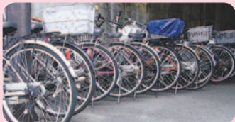
▲区内の放置自転車

駅周辺や商店街では、通勤・通学、買い物等で多くの自転車が歩道・車道に放置され、歩行者や車いす等の安全な通行を妨げています。特に、点字ブロックの上に放置すると、視覚障がいのある方が安全に通行できなくなります。また、災害時の活動にも支障を来します。思いやりを持ち、自転車の放置はやめましょう。