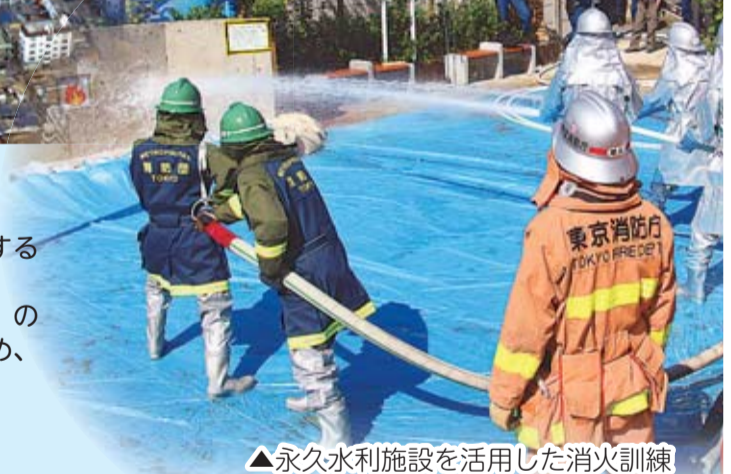
▲永久水利施設を活用した消火訓練