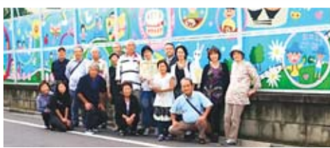
宮美大慮平前画賞し成小の受た26学皆賞活年校さ団動「環境のん体部境壁と・門境画尾環」に久境の配