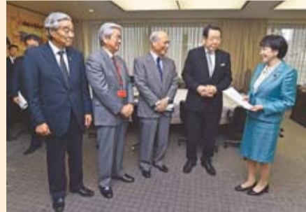
▲右から高市総務大臣、西川区長・特別区長会会長、舛添東京都知事、並木東京都市長会会長、河村東京都町村会会長

11月12日、特別区長会(東京23区)は、東京都、東京都市長会、東京都町村会と連携し、高市総務大臣に対し、地方財源の拡充に関する要請を行いました。要望内容の詳細は、特別区長会ホームページ( http://www.tokyo23city-kuchokai.jp/katsudo/youbou.html )をご覧ください。