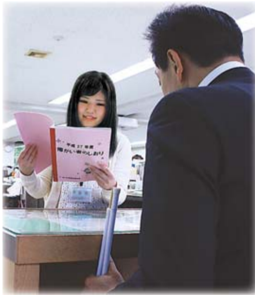
筆談や読み上げ等、ちょっとした配慮で助かる人がいます。