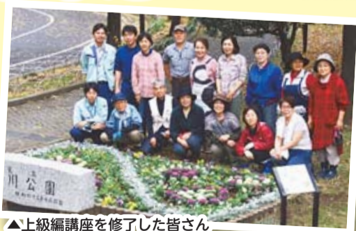
▲上級編講座を修了した皆さん

東尾久4丁目 東尾久5丁目 東尾久6丁目 東日暮里2丁目 東日暮里3丁目 西日暮里6丁目