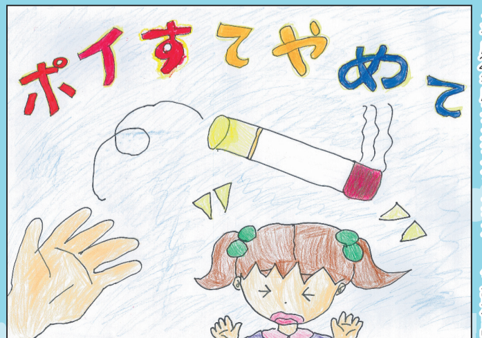
平成27年度エコポスターコンクール入賞作品