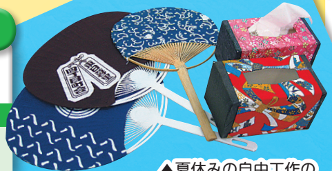
▲夏休みの自由工作の宿題はこれでギマリ