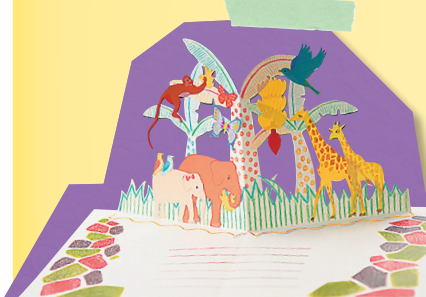
▲バナナペーパー「HARUKAのとびだすカード」