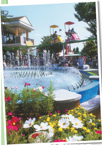
▲一般部門の荒川区長賞受賞作品(昨年)

募集期間 9月30日(金)まで テーマ 都電荒川線とバラ、沿線の風景・名物、人々の生活等 部門・大きさ ▶一般部門・都電とバラ部門...A4、四つ切(ワイド可) ▶ファミリー部門、小・中学生部門...Lサイズ 賞 荒川区長賞(賞金5万円)ほか 募集要項の配布 町屋文化センター、各区民事務所・図書館等 問合せ ACC ☎(3802)7111