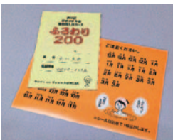
▲入浴カード「ふろわり200」