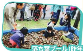
落ち葉プール(昨年)

●秋の味覚を味わおう 午前10時から整理券を配布し、小学生以下の方、300人(当日の先着順)に、焼きいもを差し上げます(焼き上がりは午前11時30分ごろ)。