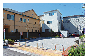
▲荒川五丁目グリーンスポット