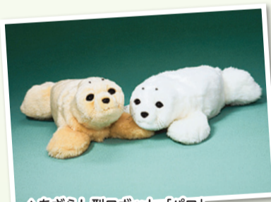
▲あざらし型ロボット「パロ」