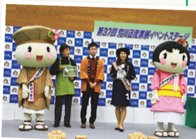
▲出展者によるプレゼンテーション