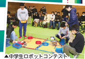
▲中学生ロボットコンテスト