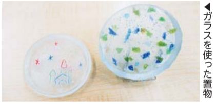
▲ガラスを使った置物