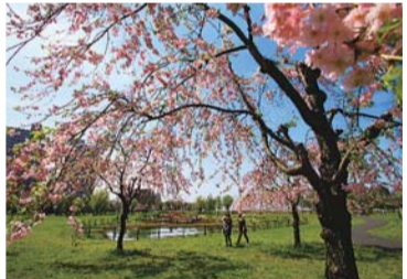
▲昨年の最優秀作品