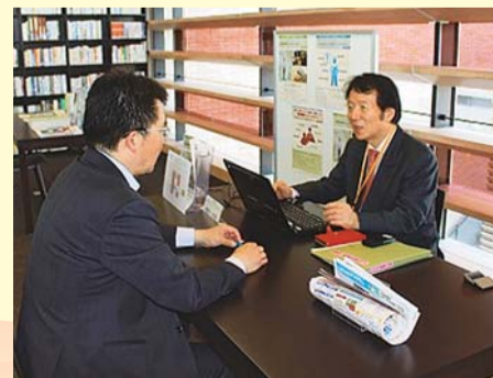
▲「中小企業よろず相談」の様子