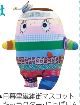
▲日暮里繊維街マスコットキャラクター「にっぽりん」

日暮里繊維街にある店舗の情報は、日暮里繊維街ホームページからダウンロードできる「にっぽり繊維街まっぷ」をご覧ください。