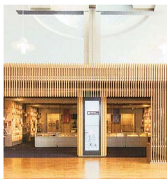
▲福井県ふるさと文学館