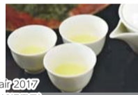
©UJI-CHA Fair2017 (京都府山城広域振興局)