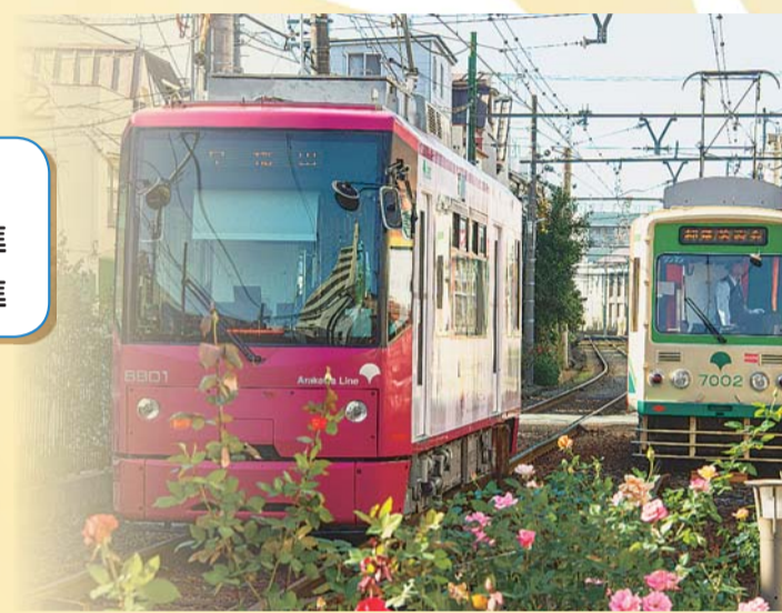
都電荒川線のバラ