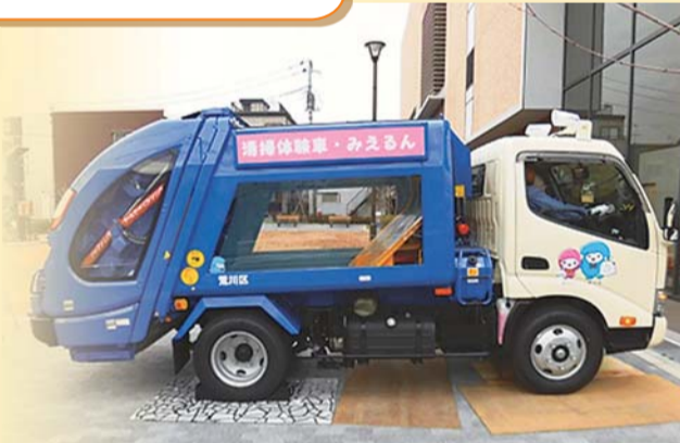
清掃体験車「みえるん」