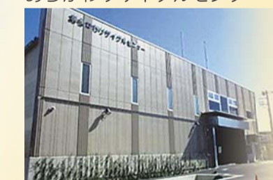
あらかわりサイクルセンター