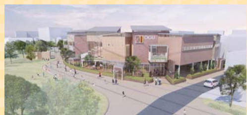
▲新たな尾久図書館外観イメージ

平成32年度の開館を目指し、宮前公園から図書館内に気軽に立ち寄れる滞在型の図書館の整備を進めています。館内には全世代が集える「ひろば」を整備し、新しい本やさまざまな人と出会う「世代間の交流」を推進します。