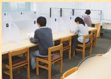
▲新しくなる閲覧室

4月21日(土)に日暮里図書館がリニューアルオープンします。館内を模様替えるほか、飲食スペースやグループで学習できる部屋等を設置し、トイレや閲覧室の机等も新しくなります。リニューアルオープンに併せて、イベントを行います。