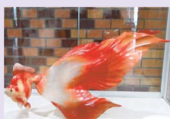
▲山村美葵氏作「朱夏の夢」