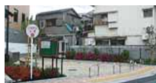
▲花の木防災スポット