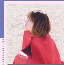
▲シンガーソングライター・川嶋あいさん

3歳まで乳児院や児童養護施設で過ごした後、川島家の養子に。2003年「I WISH」のaiとして「明日への扉」でデビュー。2006年、本格的にソロ活動スタート。代表曲に今でも卒業式で歌い継がれる「旅立ちの日に…」等がある。