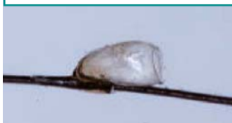
▶卵の抜け殻の有無でアタマジラミの生息を確認します