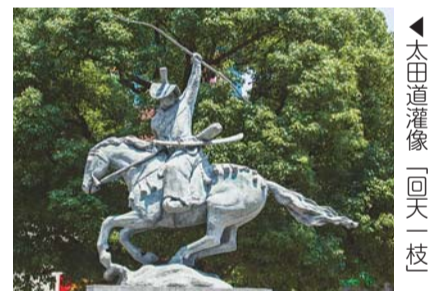
◀太田道灌像「回天」一校

荒川区観光ボランティアガイドと行く「日暮里道灌まつりまちあるきツアー」 日10月21日(日) (雨天中止) 時午前10時45分～午後0時30分 集合JR日暮里駅前イベント広場受付テント 解散日暮里繊維街周辺の地を中心に日暮里周辺を巡る 日10月5日(金)必着 ※当選者には通知します 申はがき・ファクス・電子メールで、2面上段を参照し①～④の記入事項と⑤年齢⑥代表者の氏名・携帯電話番号(②～⑤は参加者全員分<4人まで))を、〒116-8501(住所不要)荒川区役所6階観光振興課観光振興係へ 電内線461 ファ(3803)2333 電kankou@city.arakawa.tokyo.jp