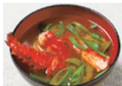
▲花咲ガニてっぼう汁

北海道くしろ地域から8市町村と専門店が出店します。 内容 ▶特産品販売 ▶ステージショー ▶あら坊・あらみオリジナルグッズプレゼント 【定員】各200人(当日の先着順) ▶じゃがいも詰め放題 【時間】▶午前11時 ▶午後3時 【定員】各30人(当日の先着順) 【費用】100円 ▶特産品が当たるクイズ大会 【日時】11月17日(日)午後1時から 問合せ 総務企画課総務係 ☎内線2191