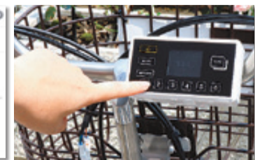
▲操作パネルで暗証番号を入力