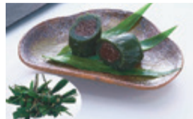
▲笹団子(新潟県佐渡市)

日時 11月10日(日)午前10時～午後3時 ※荒天中止 会場 日暮里駅前イベント広場 協力 北海道広尾町、岩手県釜石市、山形県真室川町、福島県福島市、茨城県つくば市、埼玉県秩父市、千葉県鴨川市、新潟県村上市・佐渡市、富山県射水市、日暮里まちづくり実行委員会 問合せ 文化交流推進課都市交流係 ☎内線2524