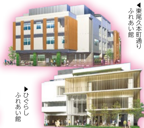
東尾久本町通りふれあい館

東尾久と日暮里地域に、子どもから高齢者まで幅広い世代が活動・交流できるふれあい館を整備します(令和4年度開設予定)。