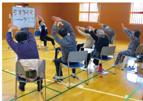
ころばん体操 (歌や手足の組み合わせ運動で脳も活性化する、転倒予防体操)