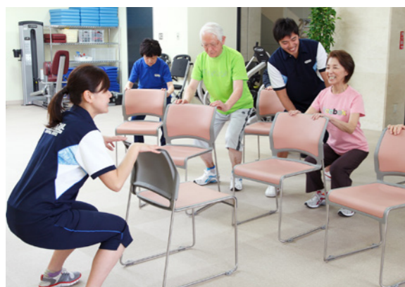
筋力トレーニング (椅子を使って安全に行うスクワットなど)

*介護予防運動指導員とは、高齢者の筋力向上トレーニングや認知症予防など、高齢者に対する介護予防の指導をする、東京都健康長寿医療センター研究所認定の資格です。