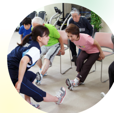
ウォーミングアップ