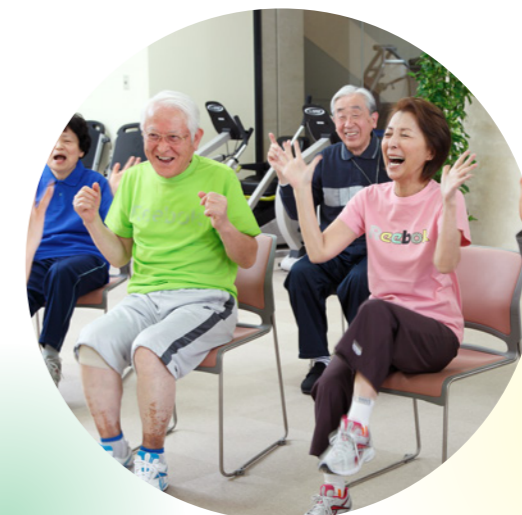
脳トレ系エクササイズ