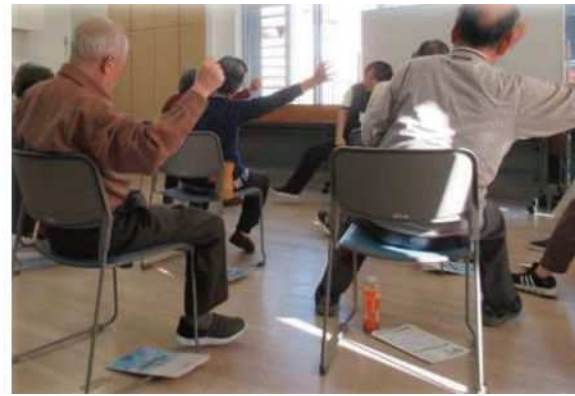
ころばん体操 (歌や手足の組み合わせ運動で脳も活性化する、転倒予防体操)