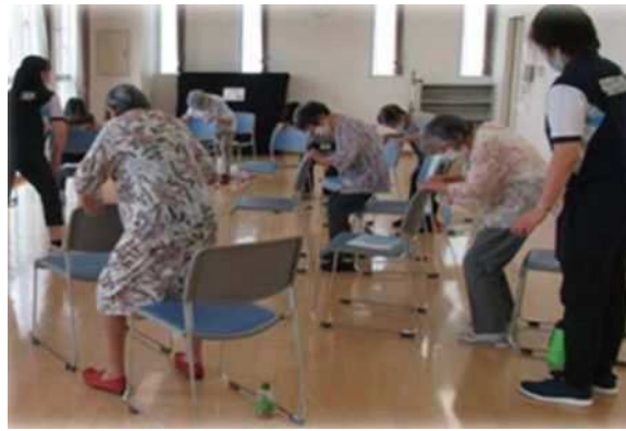
筋力トレーニング (椅子を使って安全に行うスクワットなど)

*介護予防運動指導員とは、高齢者の筋力向上トレーニングや認知症予防など、高齢者に対する介護予防の指導をする、東京都健康長寿医療センター研究所認定の資格です。