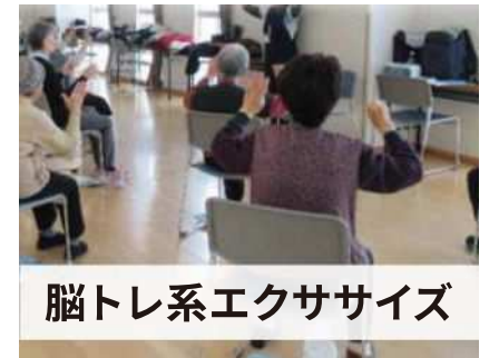
脳トレ系エクササイズ