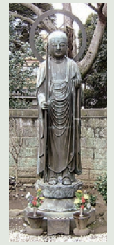
荒川区指定文化財 銅造地藏菩薩立像

江戸の後期に深川の地藏坊正元さんが建立した江戸六地藏と区別して、最初建立の江戸六地藏と呼ばれているんだ。今では千駄木の専念寺と浄光寺の2体のみになってしまったんだよ。今度の夏休み、ひぐらしの里のお地藏さんを訪ねてみてね。