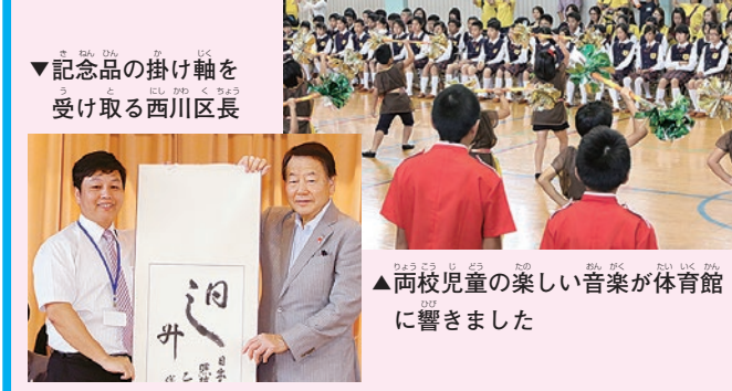
両校児童の楽しい音楽が体育館に響きました

7月7日、台湾・桃園文華国民小学校の吹奏楽団が、第六瑞光小学校を訪問し、両校の児童が音楽を通して交流を行いました。演奏後には会場全体で拍手が沸き起こりました。また、最後には、記念品の交換を行いました。親睦を深めました。