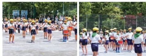
▲鼓笛パレードの様子

尾久小学校は今年で128周年の荒川区で2番目に古い学校です。 〔尾久小学校鼓笛隊〕 尾久小鼓笛隊は、6年生を中心に朝会や運動会の演奏を行っています。また、昨年から金管楽器も仲間入りしました。鼓笛隊は、毎週休み時間をけずってみんなでそろって練習をしています。毎年、運動会のパレードや社会を明るくする運動で演奏をしています。ぼくは、指揮で同じリズムでドラムメジャーを振り続けるのがとても大変ですが、聞いている人が元気になれるような演奏を目指してがんばっています。