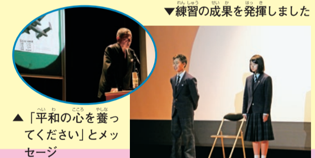
▲「平和の心を養ってください」とメッセージ