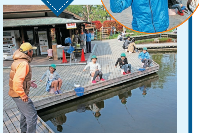
▲係員さんにエサの付け方やサオの引き方を教わりながら挑戦。誰かが釣れるたびにみんなで大喜び!

昭和62年にできた「魚釣り広場」は、ヘラブナを中心にコイや金魚が釣れるため、大人にも人気です。釣り堀には、トラック1台分の魚がいるので、釣れるチャンスは十分ありそう。希望すれば、係員さんが釣り方を教えてくれるので、初めてでも魚釣りを楽しめます。