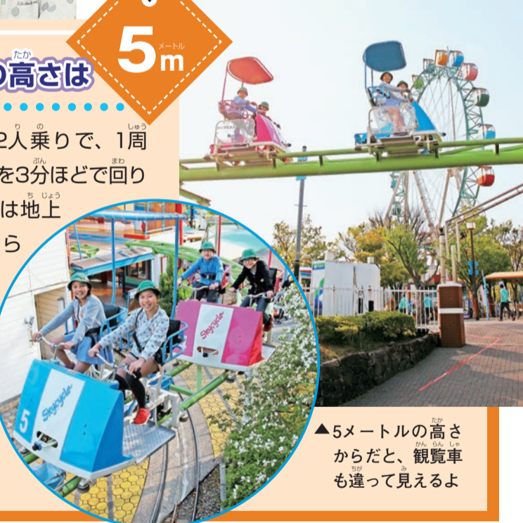
▲5メートルの高さからだと、観覧車も遠くに見えるよ