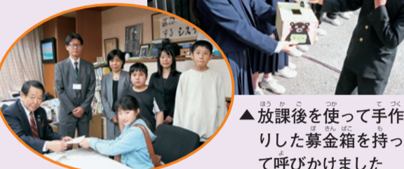
▲放課後を使って手作りの募金箱を持って呼びかけました