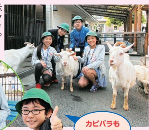
カビバラもいるんだよ

ジュニア記者がまず取材したのは、「どうぶつ広場」。ふれあい広場で、生まれて1か月半のヤギとの触れ合いを体験しました。続いて、大人にも人気の「魚釣り広場」へ。釣り方を指導してもらい、ジュニア記者全員がまず取材したのは、「どうぶつ広場」。