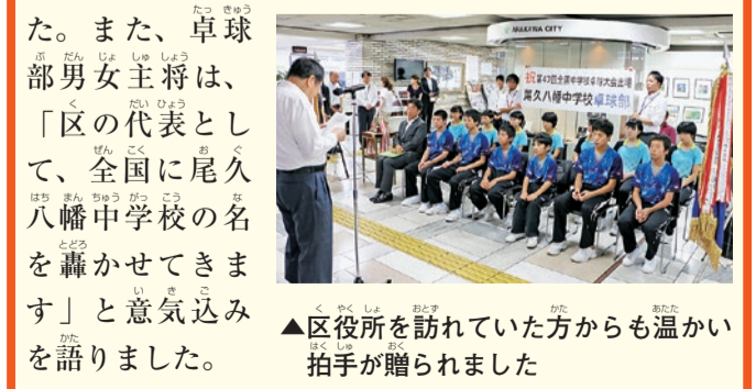
▲区役所を訪れていた方からも温かい拍手が贈られました

8月19日、尾久八幡中学校卓球部が、全国中学校卓球大会の出場を決め、大会での活躍を期待して壮行会が開かれました。尾久八幡中卓球部は東京都代表として「第44回関東中学校卓球大会」に出場し、全国大会への切符をつかみました。