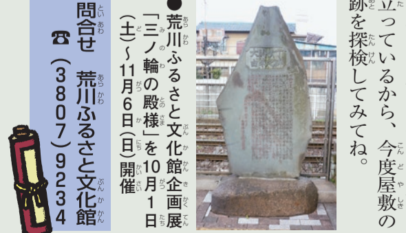
●荒川ふるさと文化館企画展「三ノ輪の殿様」を10月1日(土)〜11月6日(日)開催

六瑞は大関屋敷だった。大関屋敷は、寛文元年(1661)に幕府から下屋敷として頂いたもので、南千住一丁目1〜8、10・11番付近と丁目を合せて、その後買った土地を合わせると、広さ8100坪(約26700