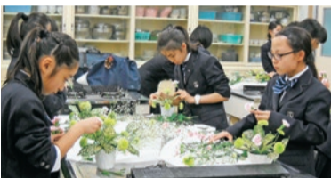
▲真剣にお花と向き合っています

私たちが3年生は、あと少しで引退ですが、より綺麗な美しい作品を作れるよう、一回一回を大切に活動していきたいです。私たちの作品により、1人でも多くの人が花の良さ、美しさを感じてくれたら、と願っています。