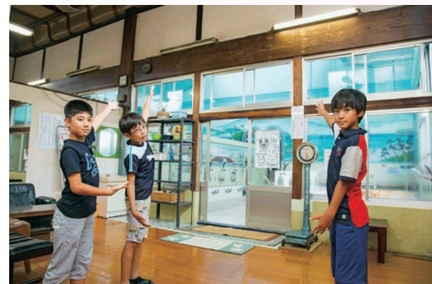
▲「ここが男湯の脱衣所だよ」もともと銭湯が大好きなジュニア記者は、和やかな雰囲気ですっかりリラックス。「早く浴室に入りたいなあ!」