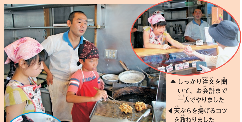
▲しっかり注文を聞いて、お会計まで一人でやりました ◀天ぷらを揚げるコツを教わりました