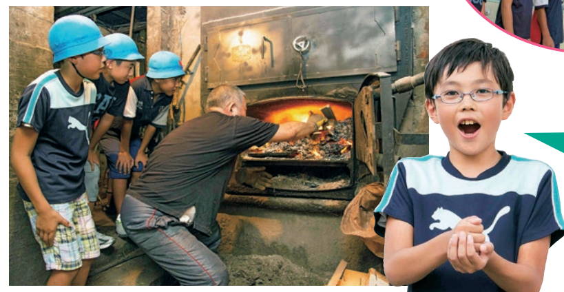
こんなふうにお湯を沸かしていただね!