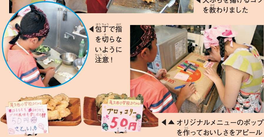
◀包丁で指を切らないように注意!