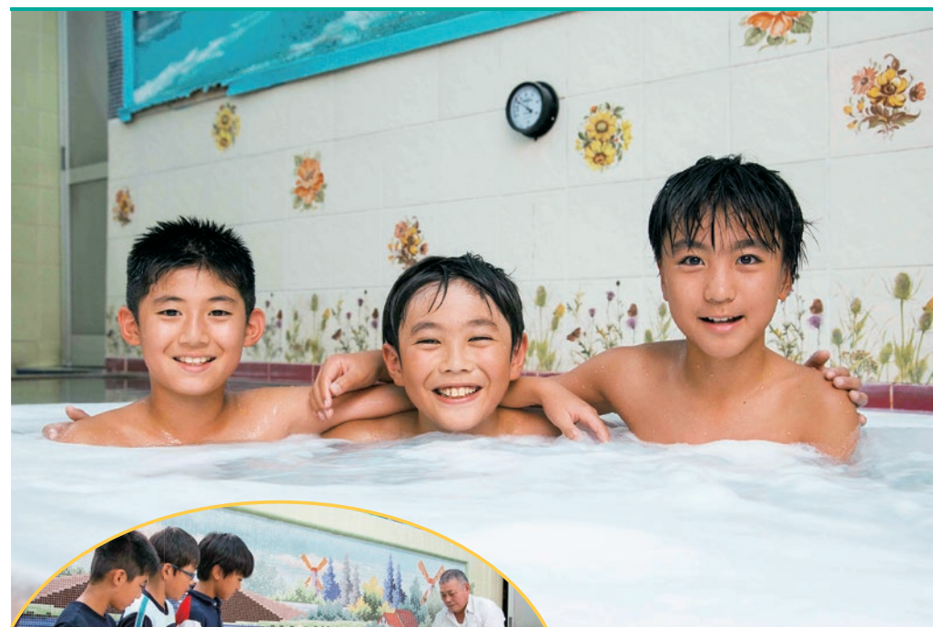
▲みんなでゆったりと気泡風呂に入りました。「湯船が広いなあ」「細かい泡が気持ちいい」と、銭湯ならではの魅力を満喫。和気あいあいと楽しめました