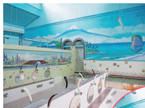
◀浴室の壁面には、雄大な富士山が描かれていました。男湯と女湯を仕切る壁の洋風なタイル絵は、開業当時に貼られたものだそうです